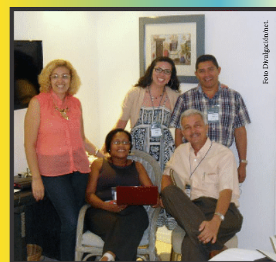
X Encuentro Internacional de Farmacovigilancia.

“La misión del equipo coordinador es vincular los Centros de Información de Medicamentos de Latinoamérica y el Caribe”.