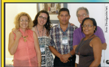
Reunión Presencial RedCIMLAC - Barranquilla 2013.